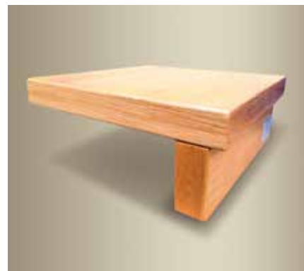
Typ D – boční lišty